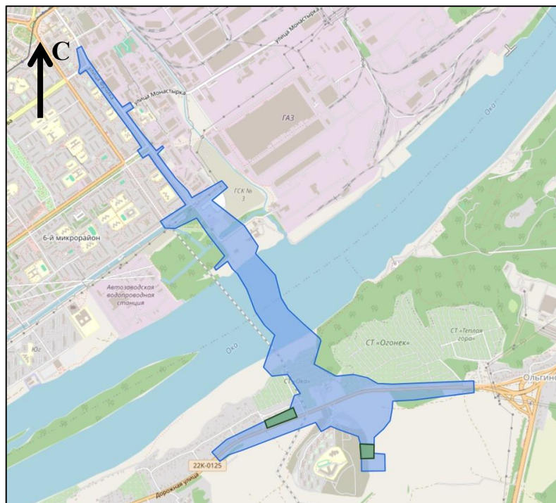
Схема границ подготовки документации по внесению изменений (арх. № 36/24)

«ПРИЛОЖЕНИЕ к приказу министерства градостроительной деятельности и развития агломераций Нижегородской области от 21 февраля 2024 г. № 06-01-02/13